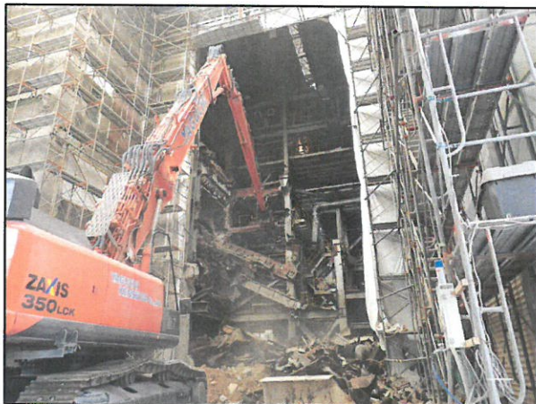
焼却設備の解体状況(平成29年6月26日撮影)