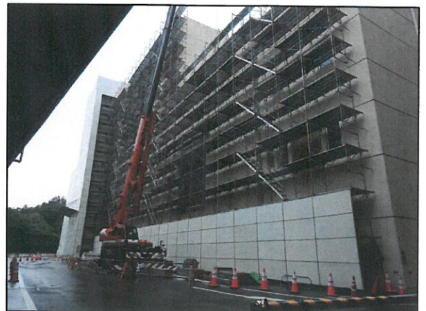
旧工場棟南面の外部養生組立作業状況(平成29年6月28日撮影)