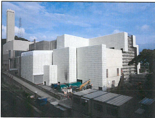
北面の作業状況(平成29年6月30日撮影)