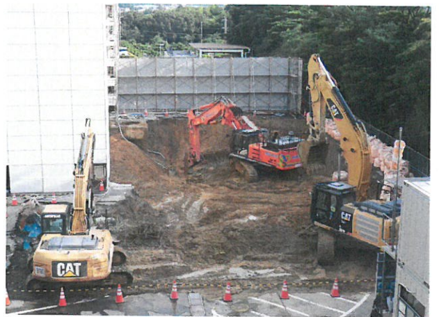
煙突基礎の解体状況(平成29年6月30日撮影)